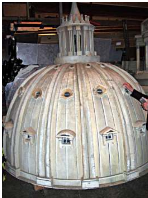
På operascenen serveras många geniala illusioner. Sankt Petersdomen gjord av cellplast och målad till väderbiten äkthet ser mycket mindre imponerande ut i förrådet än i Toscas slutscen.