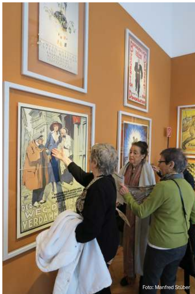
Historiens vingslag. En påminnelse om tidens aktuella samhällsfrågor.

På konsthantverksmuseet MAK kunde vi under dag tre botanisera bland glasföremål, mattor och möbler men också njuta av ytterligare verk av Klimt och andra konstnärer. En efterföljande arkitekturpromenad tog oss till Otto Wagners skapelser Postsparkasse, Karlsplatz järnvägsstation och Majolikahus och till andra berömda byggnadsverk som Musikverein och Secessionsbyggnaden. Efter en lunch i folkträngsel och vackert väder på Nussmarkt hann några av oss med en guidad tur på operan.