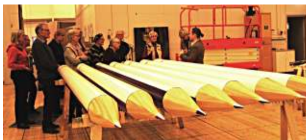
Unga Operans nya verk Den långa långa resan har inspirerats av tecknaren Ilon Wiklands flykt undan kriget. Hennes tecknande illustreras med jättestora färgpennor – framställda av avloppsrör i plast.