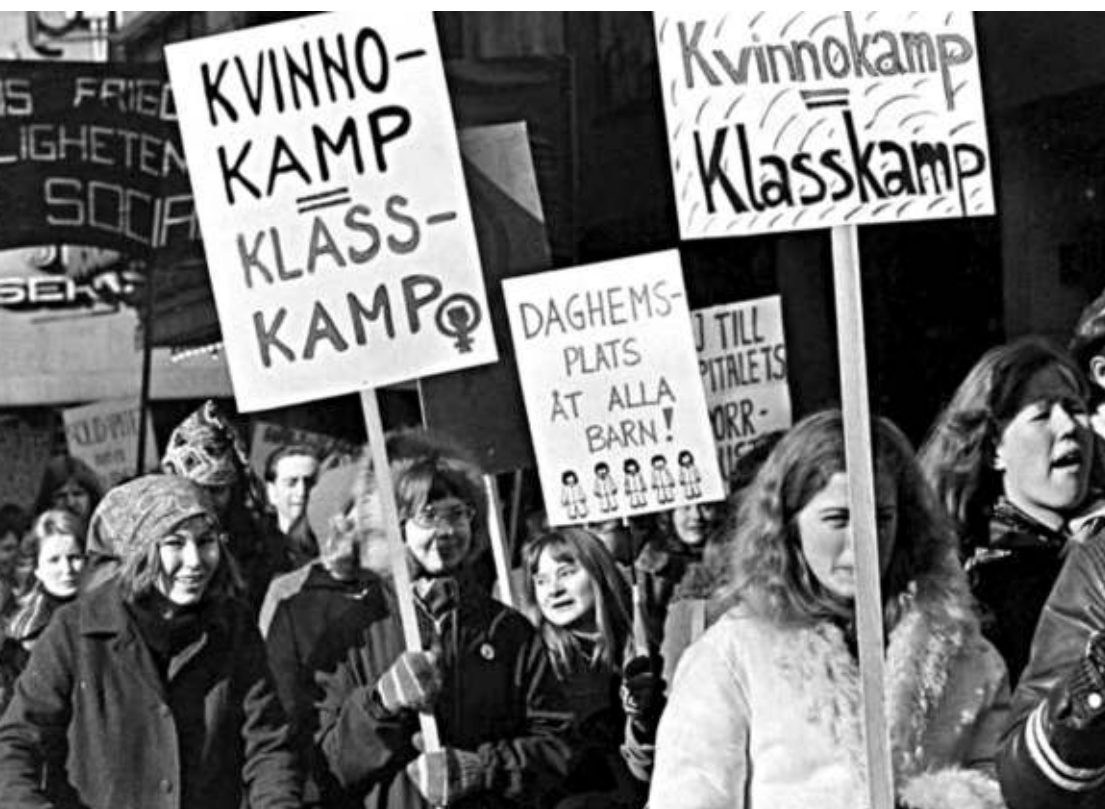
Grupp 8 gjorde kvinnokampen kul och inspirerande – och utträttade mycket.

Det är härligt att höra sin samtidshistoria framförd av skickliga föreläsare. "Revolutioner i kvinnovärlden 1900–1970" som gavs av Uppsala Senioruniversitetet våren 2017 var en av de mest inspirerande föreläsningsserier jag kan minnas. Den skildrade ju oss lite äldre kvinnor och våra liv.