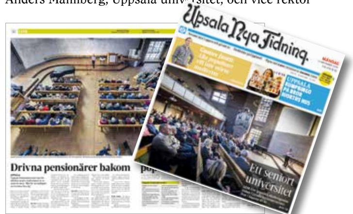
Dagen före jubileumsfirandet 12 november hade UNT en stort uppslagen artikel om USU och jubileet. Förstasidesnyheten bidrog till att hundratalet nya medlemmar anmälde sig inom några dagar.