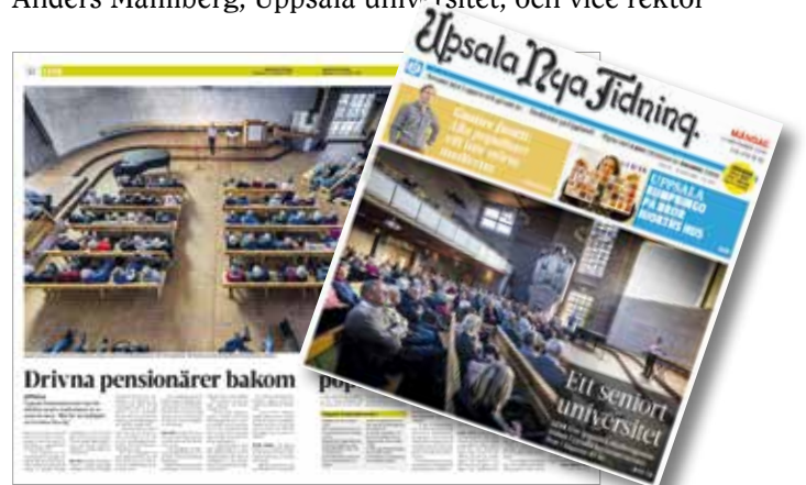
Dagen före jubileumsfirandet 12 november hade UNT en stort uppslagen artikel om USU och jubileet. Förstasidesnyheten bidrog till att hundratalet nya medlemmar anmälde sig inom några dagar.