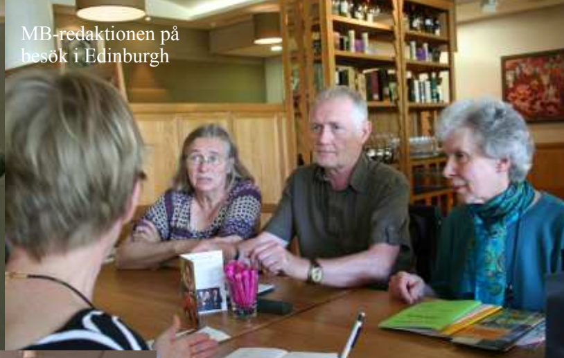
MB-redaktionen på besök i Edinburgh