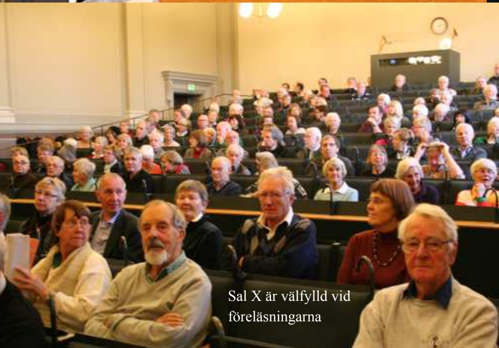
Sal X är välfylld vid föreläsningarna