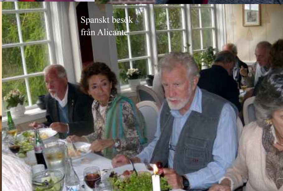
Spanskt besök från Alicante