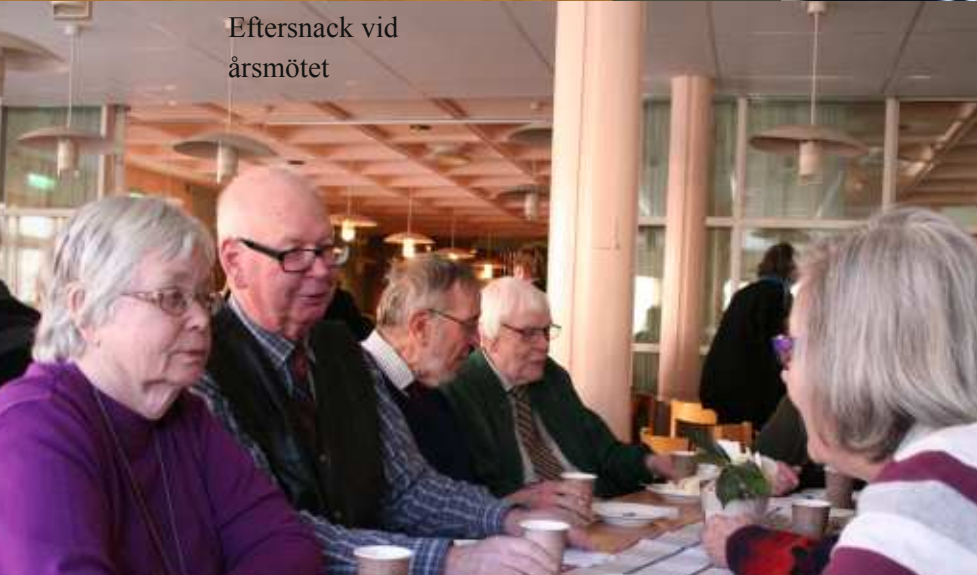
Eftersnack vid årsmötet