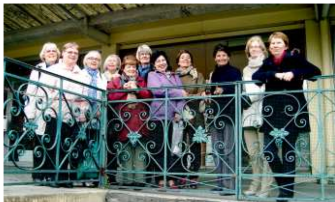
Svenska gruppen och några av värdarna på väg in i de långa vinkällarna.

Den sista veckan i augusti fullföljdes så andra delen av utbytet. När de åtta fransmännen anlände med