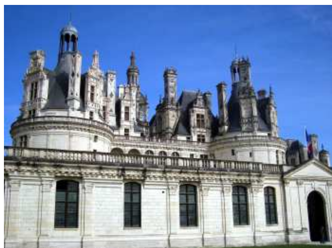
Det mäktiga slottet Chambord.

Gruppen som omnämns i artikeln om Orléans bestod av åtta franskinsresserade personer som hade anmält sitt intresse via Medlemsbladet. Ett par av deltagarna hade gått i en av Senioruniversitetets språkcirklar. Initiativtagare var två f.d. språklärare i Senioruniversitetets internationella grupp.