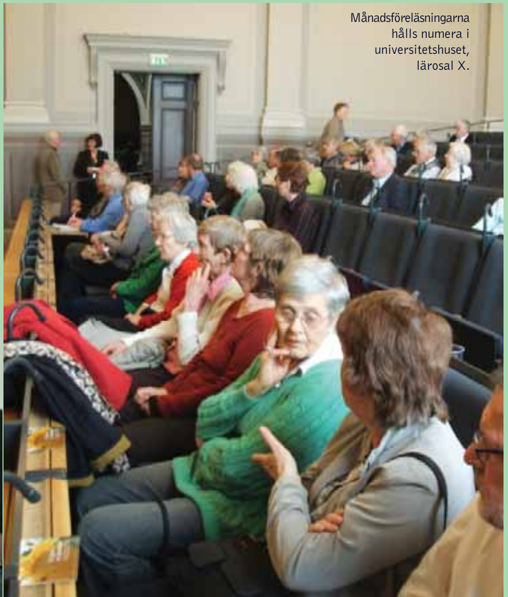
Månadsföreläsningarna hålls numera i universitetshuset, lärosal X.