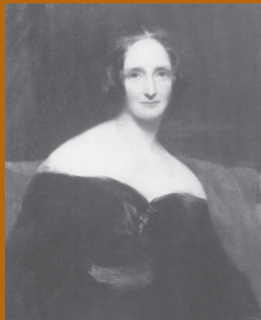
Två av de författare som behandlas under kursen: Mary Shelley (Frankenstein) och Harry Martinson (Aniara)”