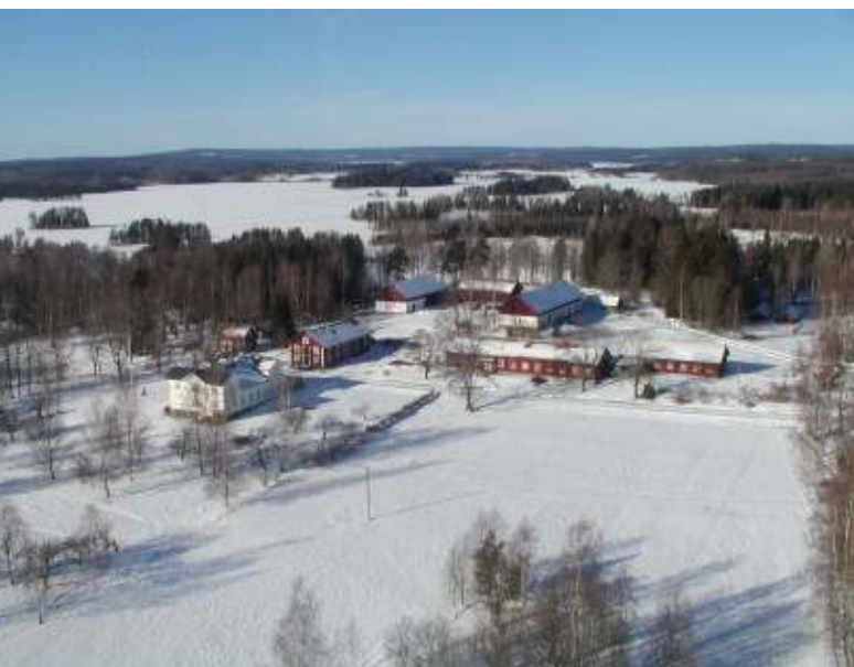
Gruppen från Senioruniversitetet kommer att bo och äta på Grimsö herrgård. På bilden syns också viltforskningsstationen och sjön Sörmogen.

Läs mer om viltvårdsaktiviteten på sidan 26 i vårprogrammet!