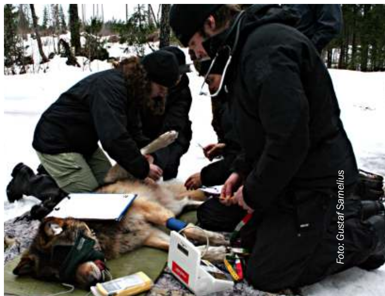
Grimsö ligger inom ett vargrevir. Här pågår vargmärkning.