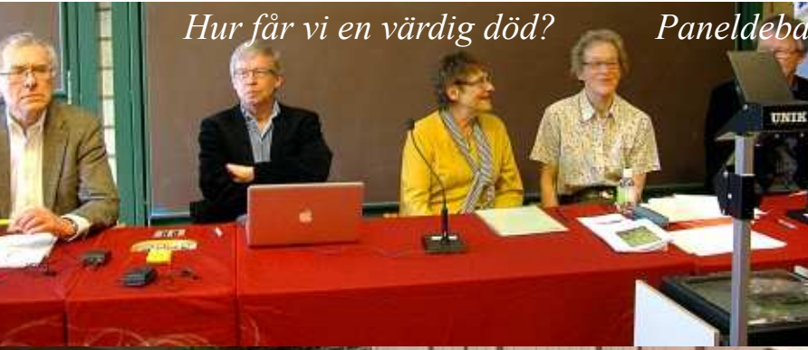
Paneldebatt med intresserade lyssnare