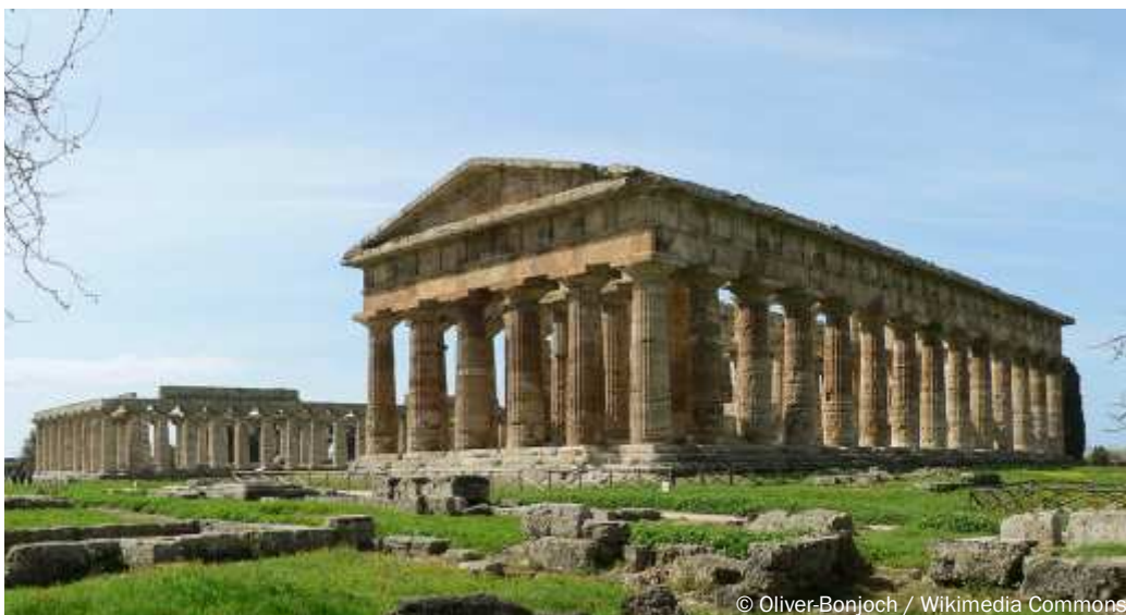
Veduta di Paestum