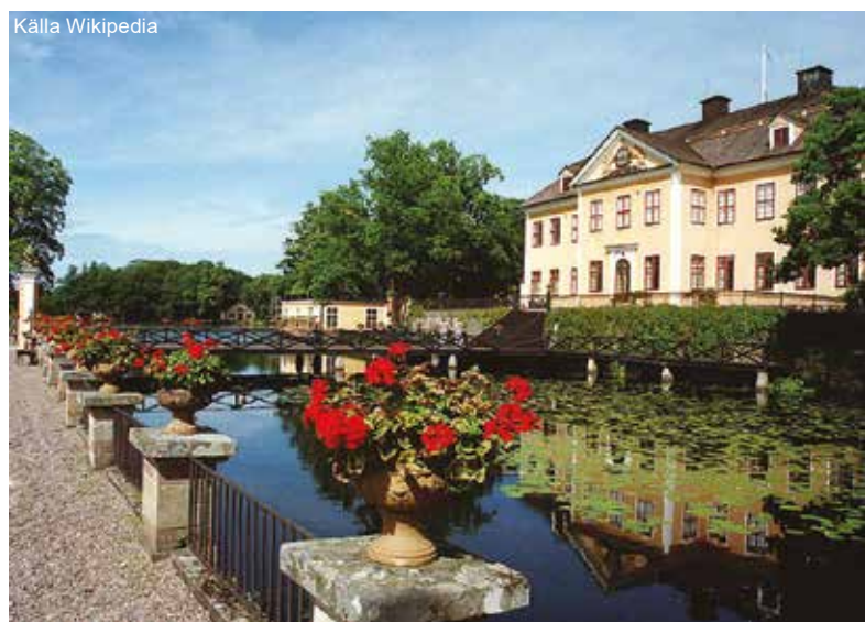
Lövstabruk Herrgården och dammen.