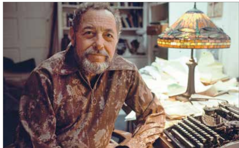
Tennessee Williams.