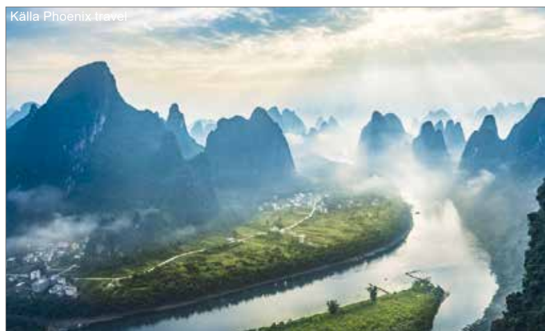
Li floden med mount i Guilin, Kina.

För mer information och detaljerat program, kontakta Kinalotsen: e-post: resor@kinalotsen.se , telefon: 018-122888.