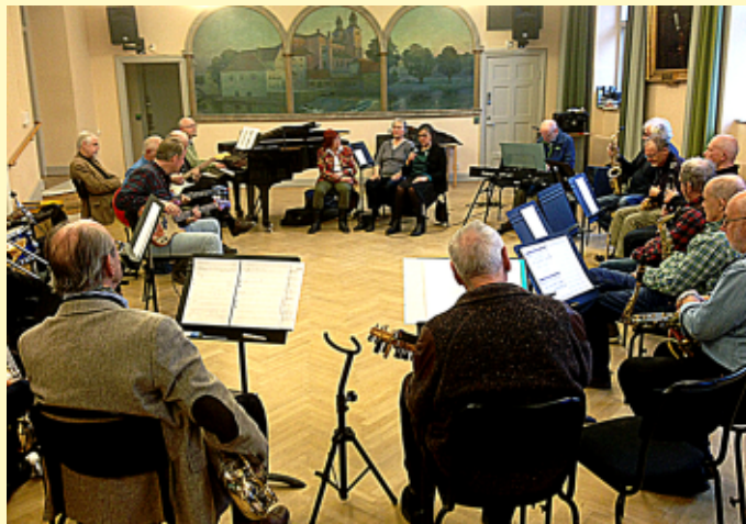
Senioruniversitetets jazzensemble våren 2016