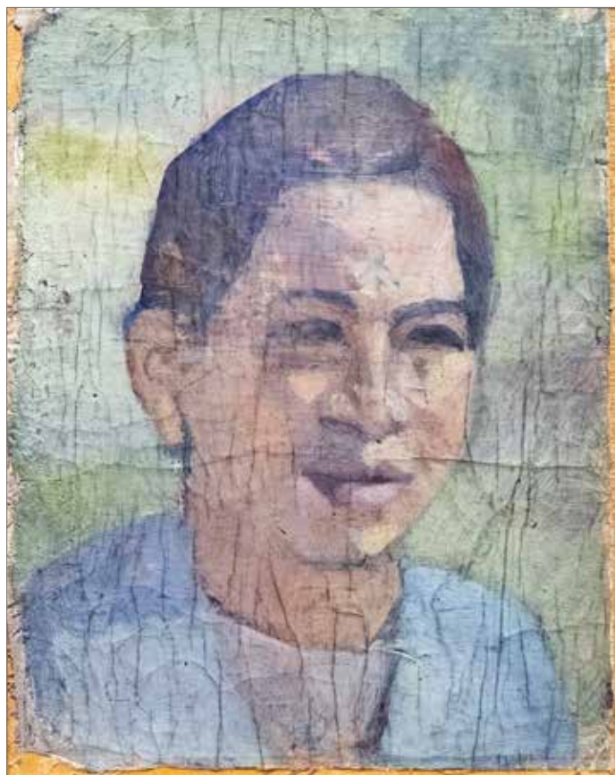
Egyptiska I 1914-15 © Ivan Aguéli

(Se vidare Medlemsblad 3 och webbplatsen.)