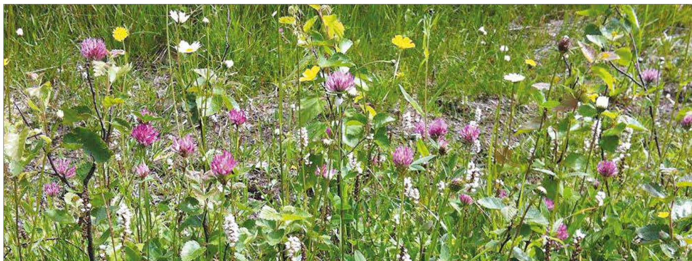
Vägkanter kan vara miniängar med många sorters blommor.