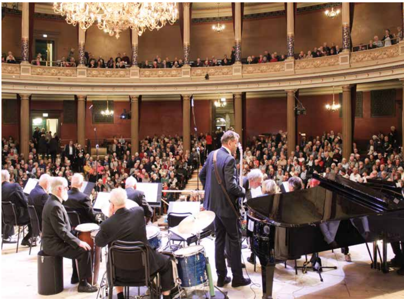
Jazzensemblen spelar vid Senioruniversitetets 40-årsjubileum i Uppsala universitets aula.