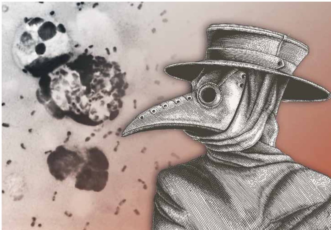
Så snart den karakteristiska pestläkaren klev över tröskeln visste européerna att döden väntade.