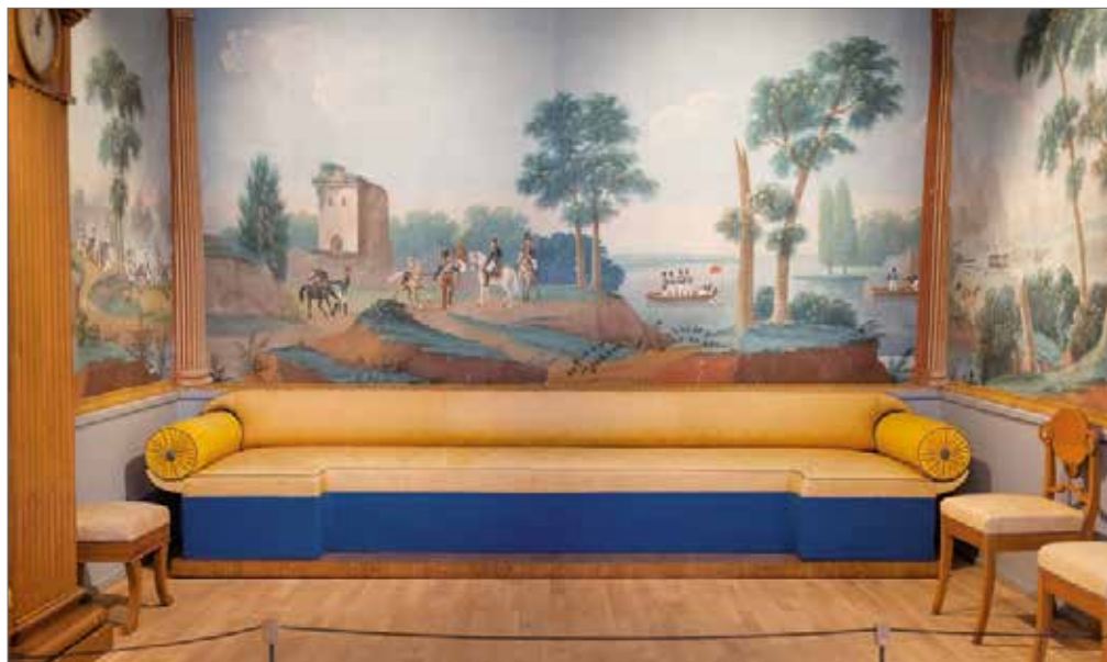
Brynässalongen är en återskapad version av ett rum som en gång fanns på Brynäs Herrgård i Gävle.