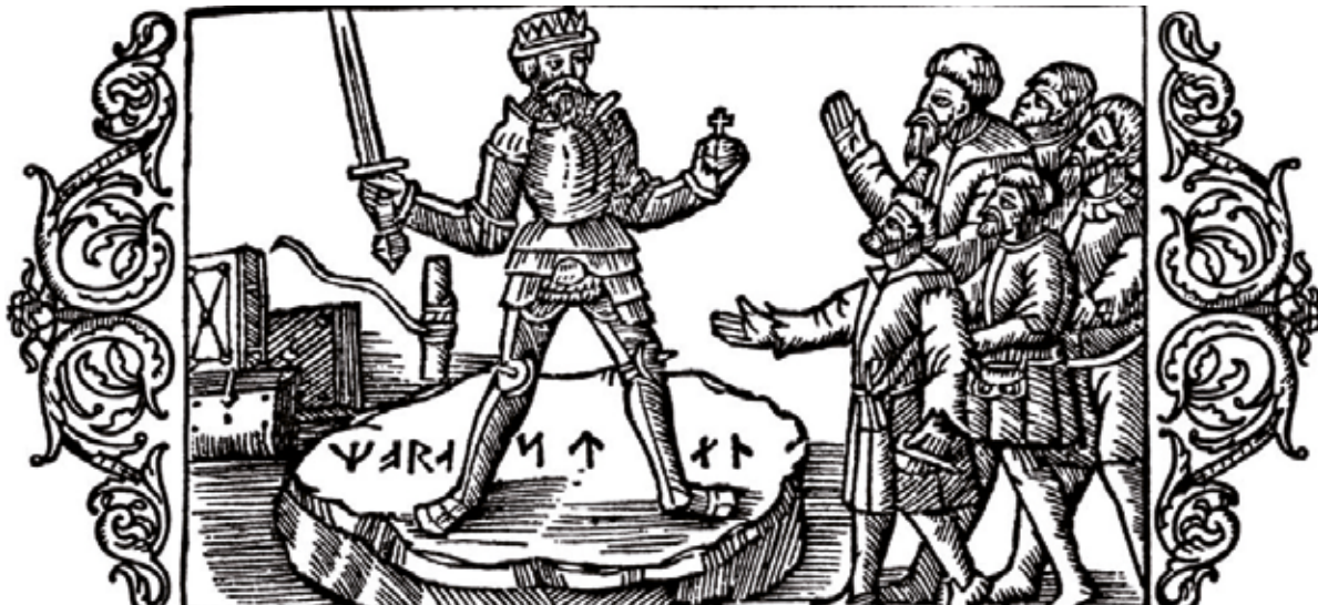
Träsnitt om konungaval ur Olaus Magnus Historia om de nordiska folken.

Vid Mora äng i Lagga sägs Magnus Ladulås ha valts till kung år 1275. Åtskilliga kungar har valts efter honom på samma plats, som i dag kallas Mora stenar efter de dokumentationsstenar man funnit. Ett studiebesök till Mora stenar planeras i anslutning till serien Medeltiden – både fjärran och nära , med företrädare för deltagare i serien. Mer information kommer på webbplatsen: www.usu.se