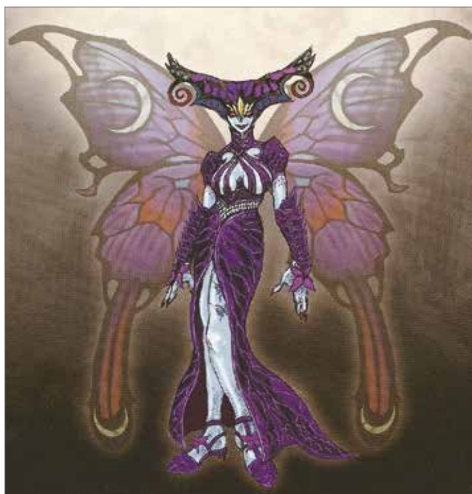
Madama Butterfly.