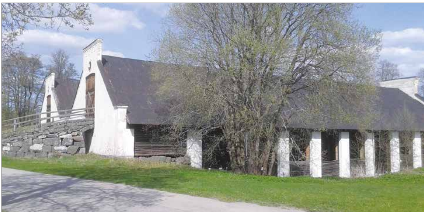
Kolhusen vid Gimo bruk.