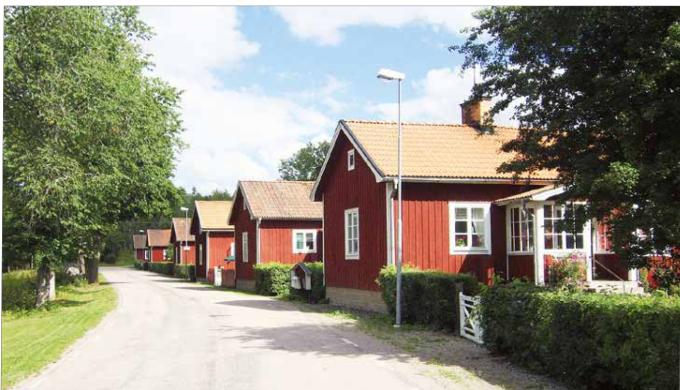
Länsväg C 717, bruksgatan i Hillebola.