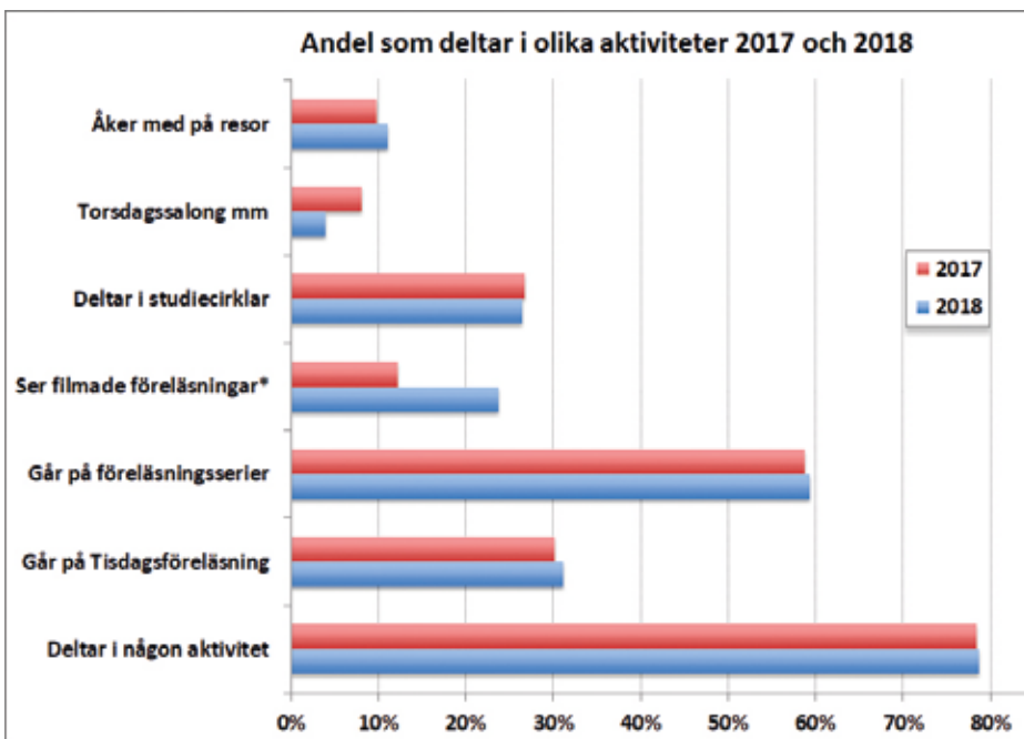
Andel som deltar i olika aktiviteter 2017 och 2018