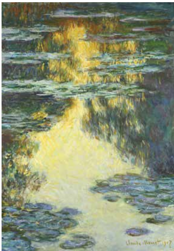
Claude Monet, Näckrosor, Göteborgs konstmuseum. Utförd 1907