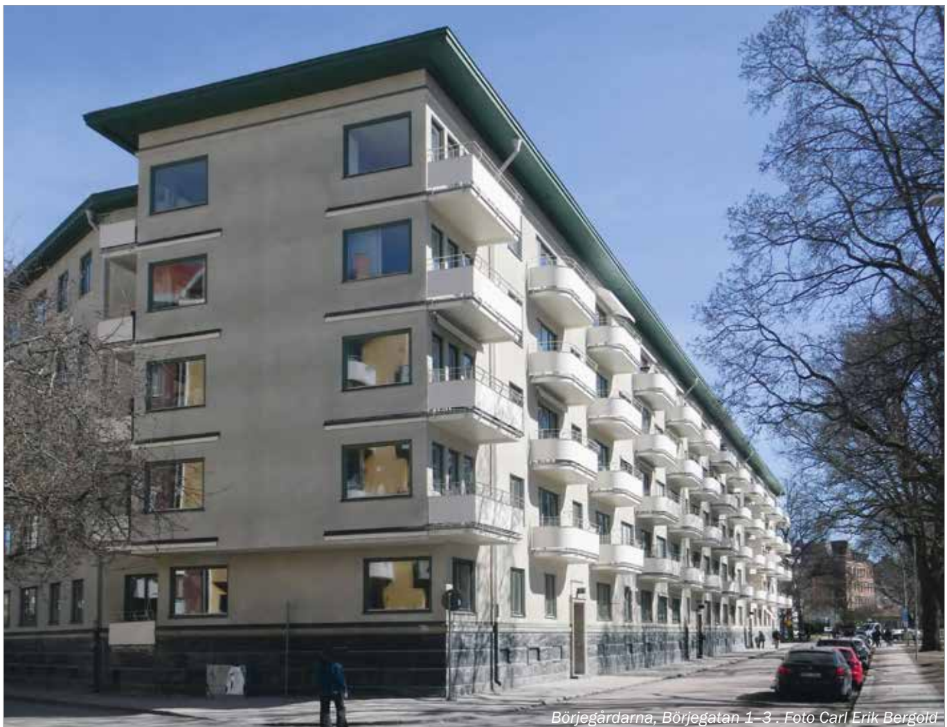
Börjegårdarna, Börjegatan 1–3.

Lottning: Tisdag 14 maj, därefter direktanmälan.