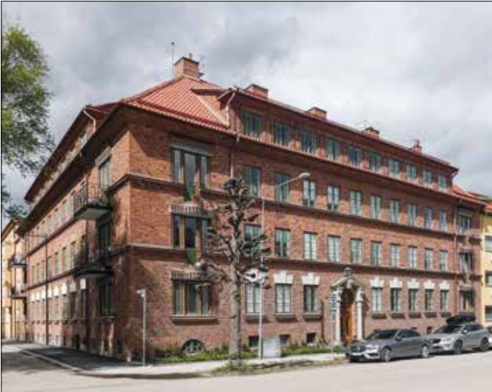
S:t Erikshuset. Arkitekt Gunnar Leche.